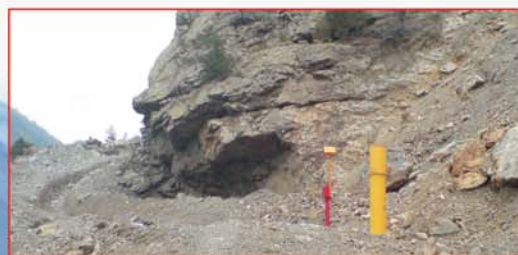
Контрольный пункт ИВ