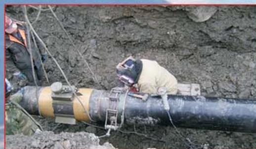
Врезка патрубка измерительного